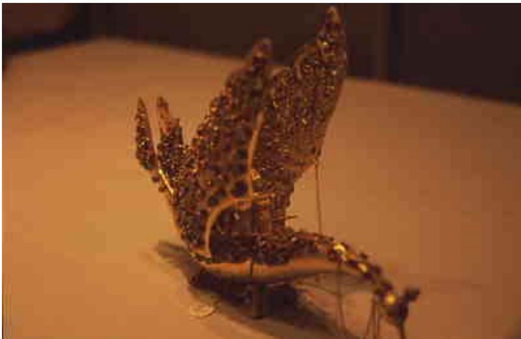
Modell eines Vimana

Mahinda und seine Vimana - am Ende doch nur eine Legende?