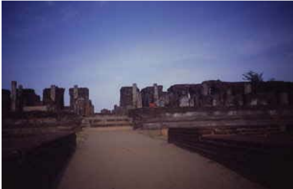
Ruinen des einstigen Palastes in Polonnaruwa

Zum besseren Verständnis dieses Berichtes erscheint jedoch eine kurze Darstellung der frühen Geschichte Sri Lankas erforderlich. Als erste Siedler der Insel im indischen Ozean gelten die Weddas. Heute leben noch etwa 800 von ihnen in den unzugänglichen Dschungelgebieten im Innern Sri Lankas - ihr Kontakt zur übrigen Bevölkerung ist mehr als spärlich. Die dunkelhäutigen, kleinwüchsigen Halbnomaden gehören zu derselben ethnischen Gruppe wie die Aborigines, die Ureinwohner Australiens oder die südindischen Bergvölker. Sowohl singhalesische als auch indische Legenden bringen die Weddas mit den sogenannten „Yakkas“ in Verbindung, den „Dämonen“, die der tamilische Prinz Vijaya besiegte, als er Sri Lanka eroberte.