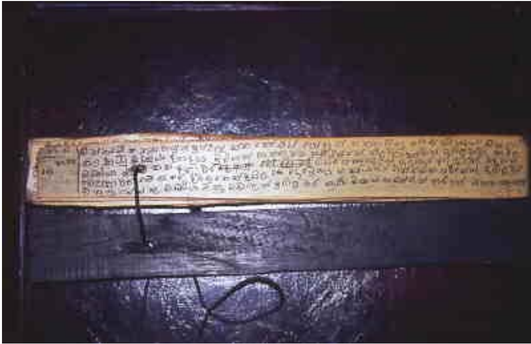
Palmbblattmanuskript mit der Beschreibung des Einsatzes von Vimanas.